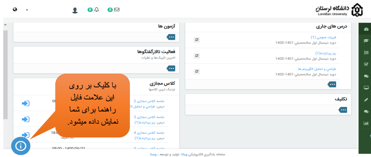
شکل شماره ۲

مرحله دوم: پس از ورود به سامانه ویانا در صفحه ی اصلی دو بخش دیده می شود. در قسمت "درس های جاری" با کلیک بر روی علامت بیشتر (سه نقطه) کليه درسهای اخذ شده در این نیمسال نمایش داده می شود. همچنین در قسمت "کلاس مجازی" با کلیک بر روی علامت بیشتر (سه نقطه) کليه کلاسهای مجازی به ترتیب اولویت زمان برگزاری نمایش داده می شود.