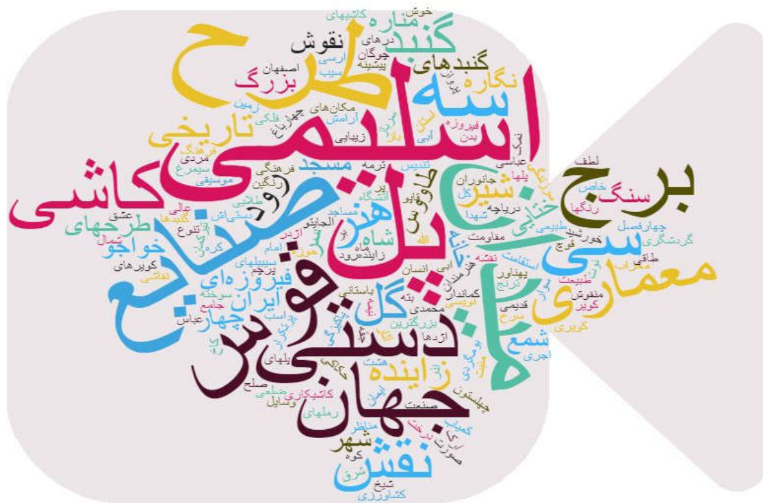
شکل ۴- ابر کلمات مربوط به اصفهان در قالب یک نماد