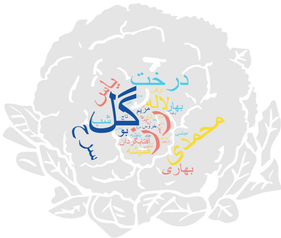
شکل ۵- ابر کلمات مربوط به تصویر اصفهان در قالب گل