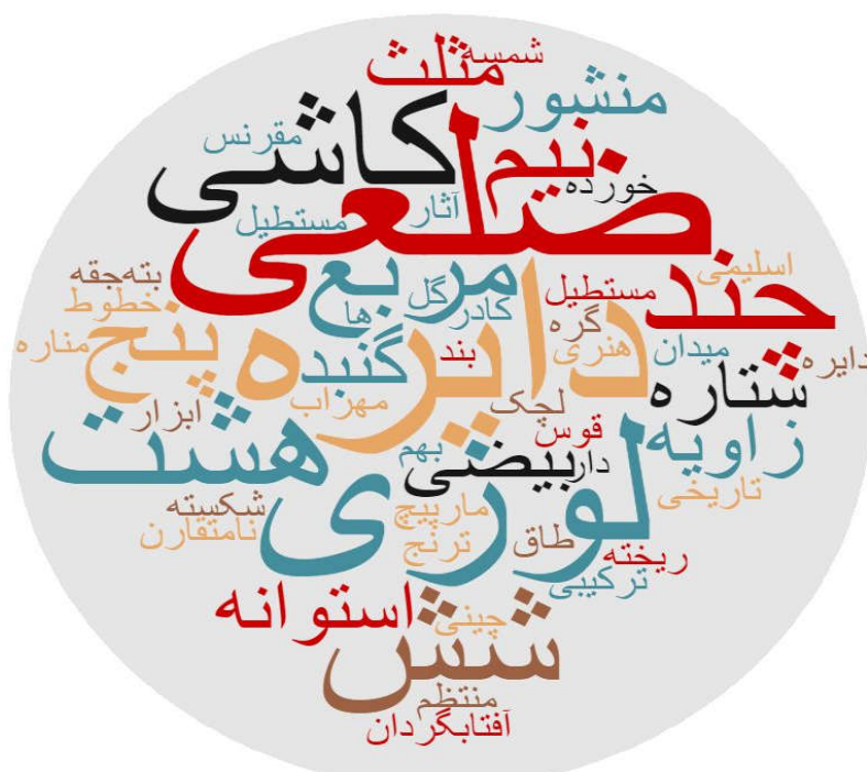
شکل ۷- ابر کلمات مربوط به تصویر اصفهان در قالب شکل هندسی