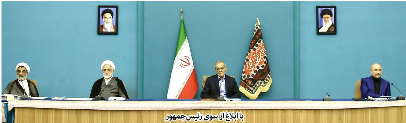
با ابلاغ از سوی رئیس جمهور

تمدید مجدد زمان ثبت نام در آزمون دکتری سال ۱۴۰۴